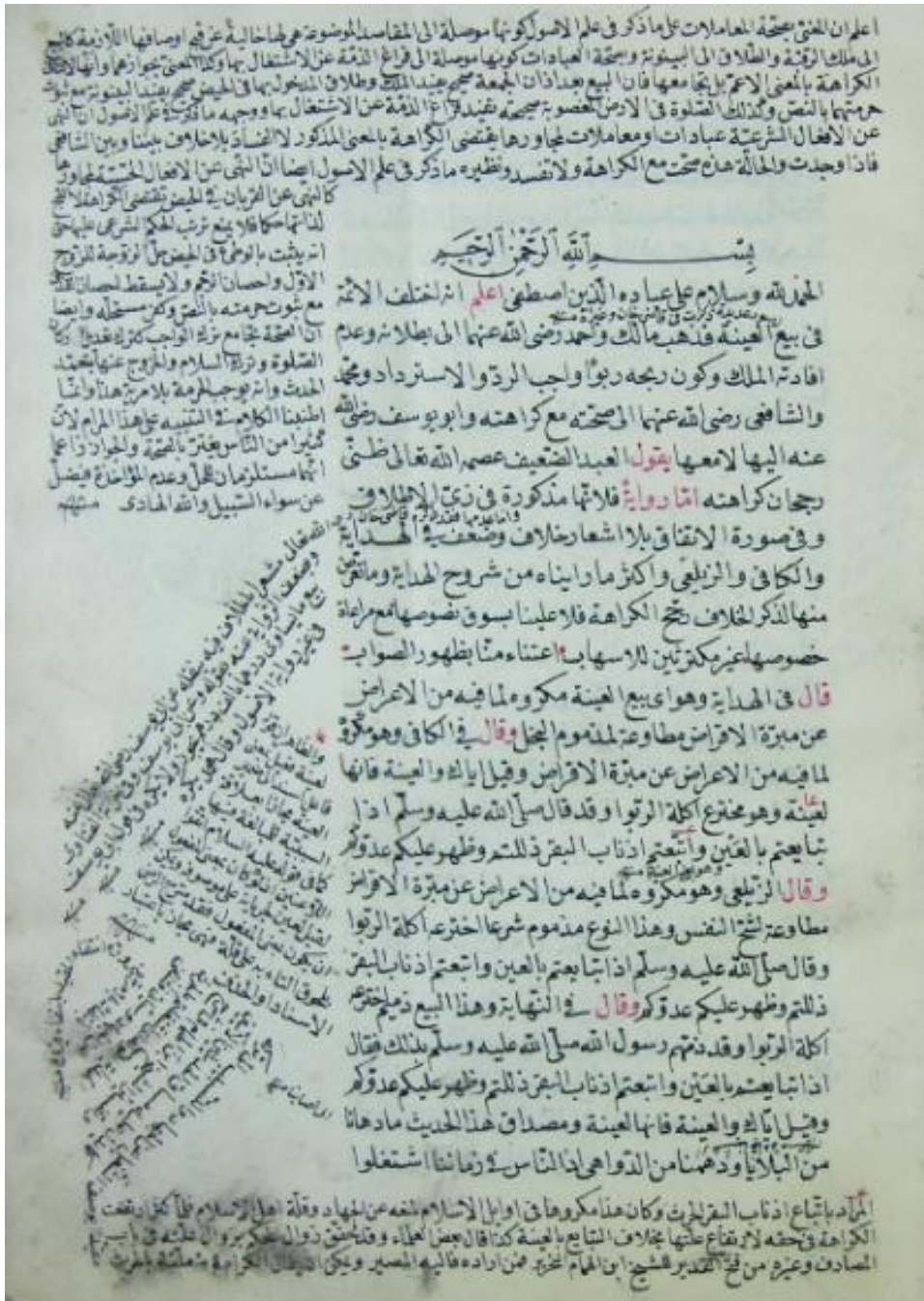
اللوحه الأولى من النسخه ( أ )