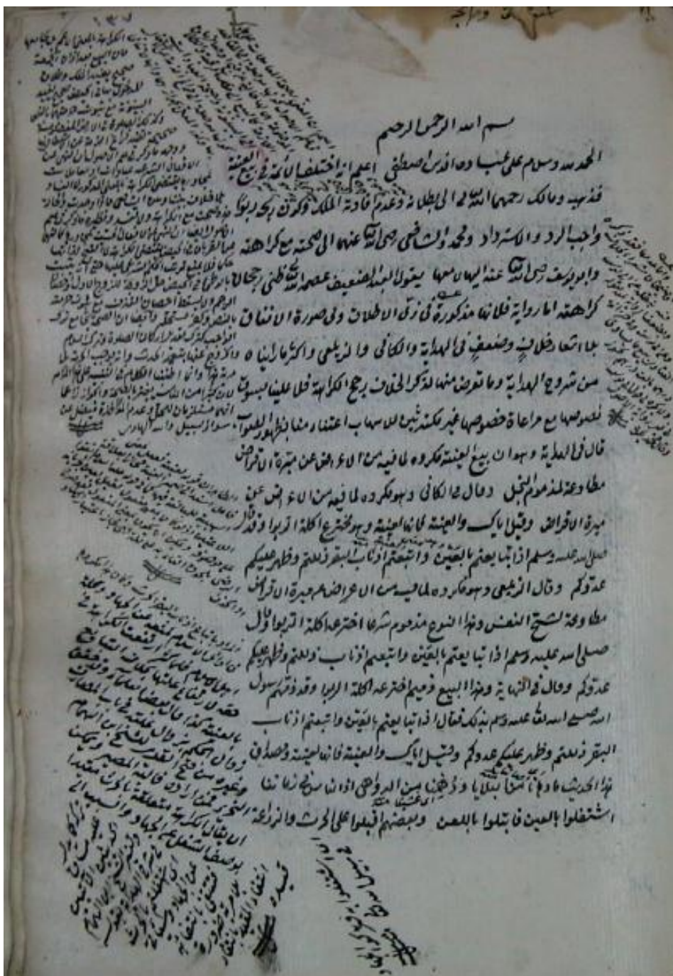
اللوحة الأولى من النسخة (ب)